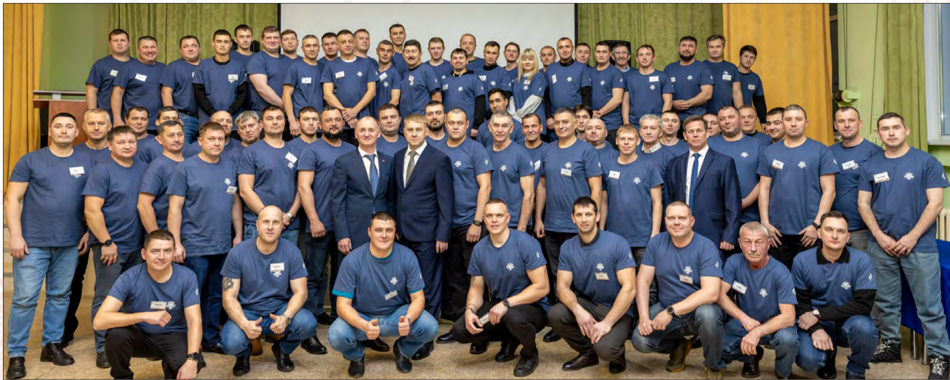
Одна пятая часть мастеров СП «Татнефть-Добыча» трудятся в НГДУ «Лениногорскнефть»

На базе отдыха «Ландыш» прошел слет мастеров НГДУ «Лениногорскнефть»