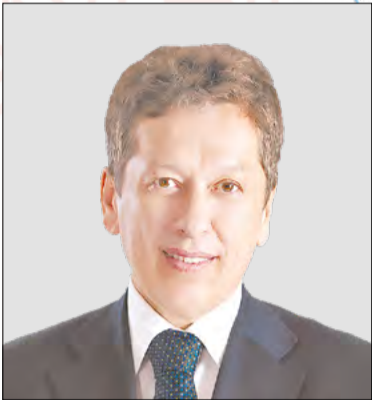
Наиль Маганов, генеральный директор Компании «Татнефть»

Подходит к концу 2024 год. Традиционно в канун Нового года мы подводим итоги и обозначаем планы на будущее.