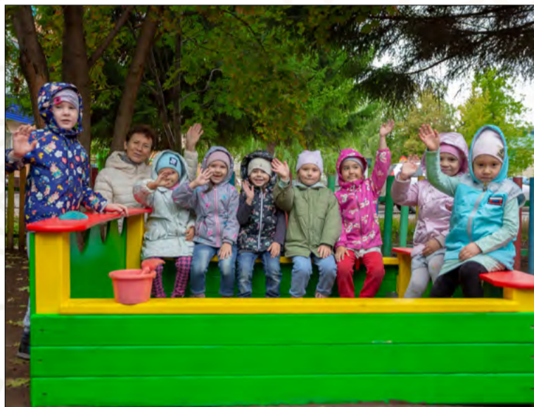
Игровые площадки от ООО «Елховлес» изготавливаются по заказу Компании «Татнефть»

Один из ключевых критериев — наличие софинансирования из других источников (частных или государственных), что позволяет повышать эффективность социальных инвестиций. Каждый представленный проект прошел