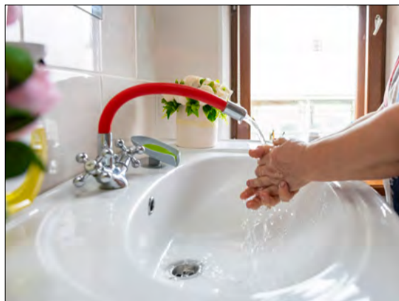
В 2024 году в селе Каркали на средства гранта обновили центральную водную магистраль. Работы продолжатся в 2025 году

унифицированную оценку при помощи специально разработанного алгоритма и ключевых критериев. После этого результаты оценки рассмотрели эксперты, а итоговый список финалистов утверждался на заседании Грантового комитета.