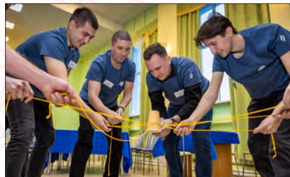
Мастера принимают участие в мероприятиях на командообразование и работе в фокус-группах

Вторая половина встречи была посвящена мероприятиям на командообразование и работе в фокус-группах. Участники погрузились в различные активности, что помогло