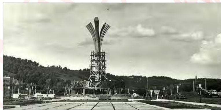
1975 год. Идет строительство Монумента первооткрывателям нефти Татарии