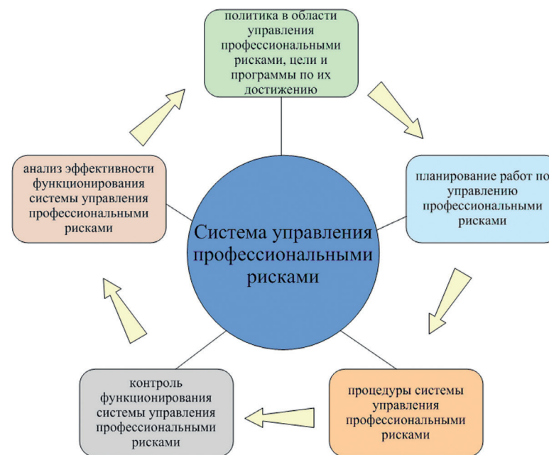
Рисунок 1. Система управления профессиональными рисками

Процесс управления профессиональными рисками включает в себя несколько последовательных этапов, приведенных в таблице 1.